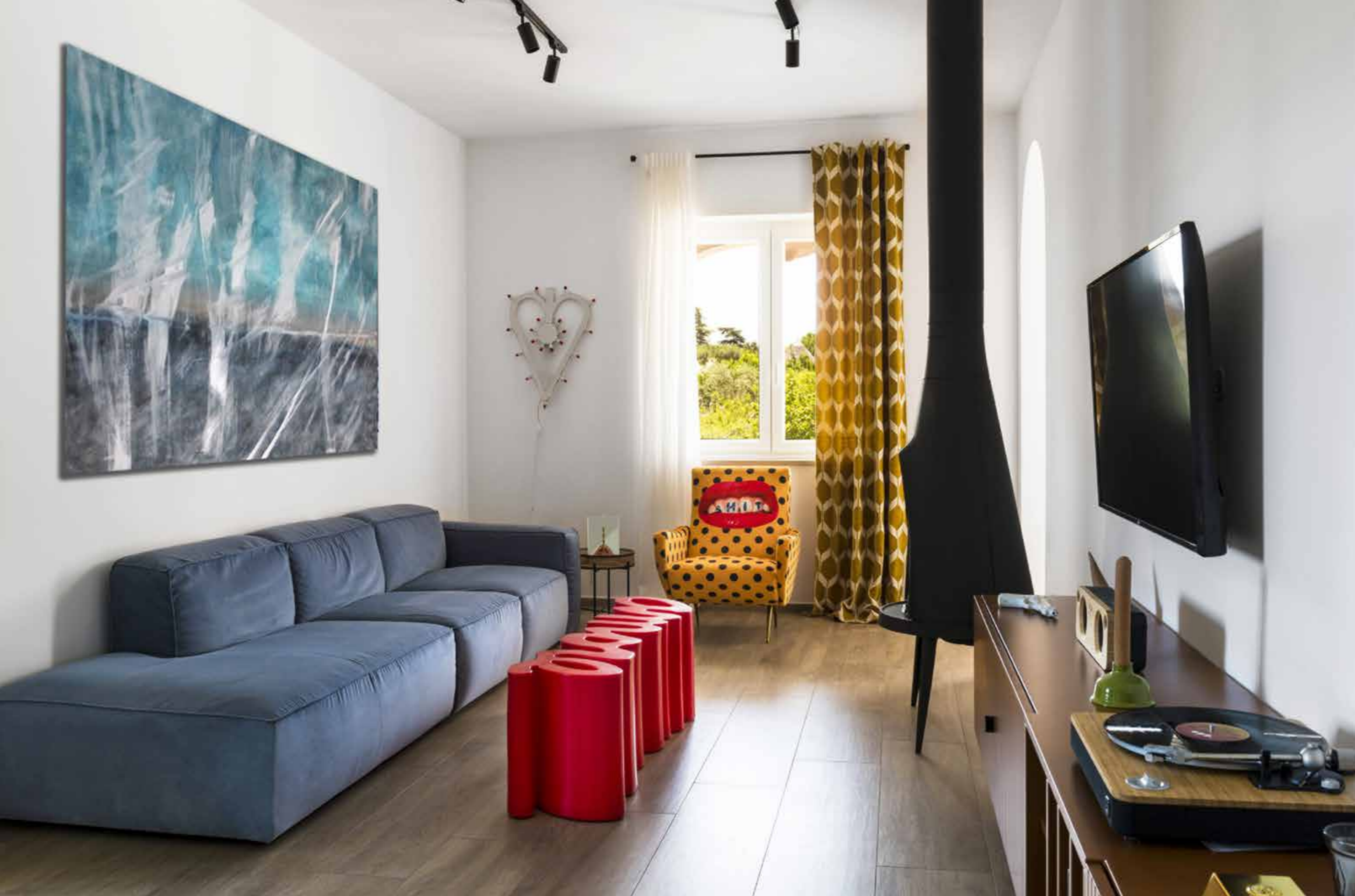
Giochi di colore nel salotto con il divano Nicoline in tessuto blu di Cairoli, panca-divanetto Amore in vernice rossa di Slide ideata da Giò Colonna Romano, camino a sospensione in ferro nero di Invicta e la simpatica poltrona gialla a pois Toiletpaper di Seletti.

> a questo appartamento uno stile più attinente alla giovane coppia committente. Gli spazi interni, rispetto al progetto di partenza, sono stati completamente ripensati e hanno preso vita attraverso uno studio molto curato di demolizioni e costruzioni. L'ingresso minimale con parete armadiata e bagno ospiti indirizza verso la zona living che, insieme alla zona giorno, crea un unico ambiente ampio e luminoso. Un arco dall'importante luce è stato progettato ex novo per creare un filtro tra la zona giorno e la cucina. I mobili sono stati appositamente progettati e disegnati su misura per donare luce e dinamismo all'ambiente. Dalla zona giorno un piccolo disimpegno divide le due stanze da letto, di cui una comprensiva di un'ampia e luminosa cabina armadio, e il bagno, caratterizzato dalla continuità di materiali tra pavimento e rivestimento.