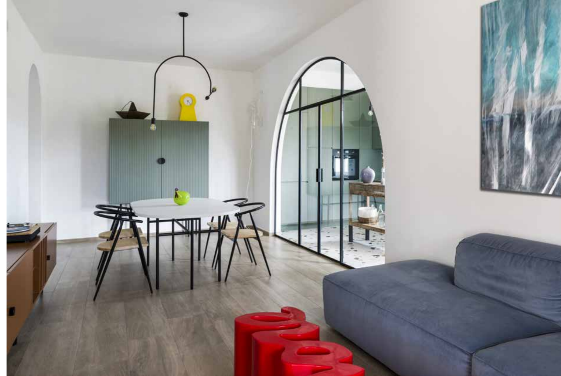
A sinistra: zona pranzo con credenza in legno verde e tavolo realizzati su disegno dallo studio ABBW, lampada a parete Monkey di Seletti. Sopra: zona living e pranzo uniformate dal caldo e avvolgente pavimento Ascot Steam Work Quercus; lampadario realizzato su disegno dallo studio ABBW. Sotto: porta ad arco in ferro che introduce alla cucina realizzata su disegno dallo studio ABBW.