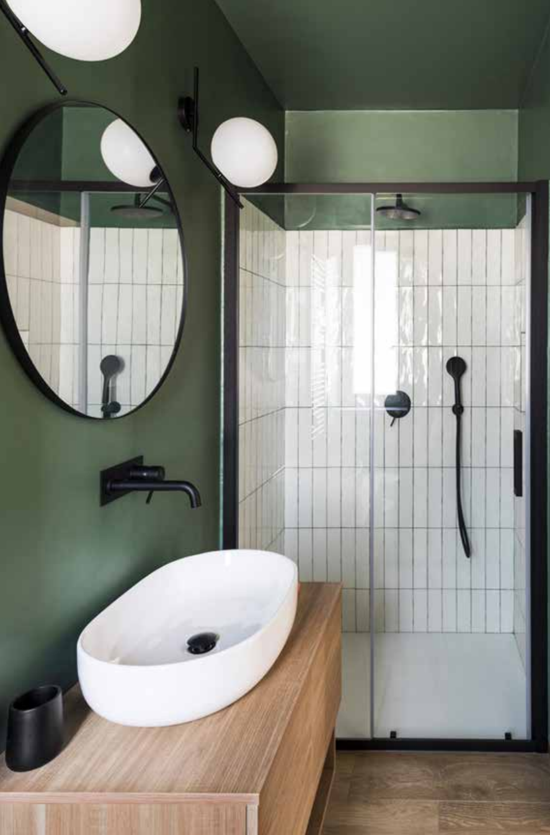
Nota di colore anche per il bagno ospiti con doccia in contrasto cromatico; mobile sospeso con lavabo in appoggio e rubinetterie color nero.